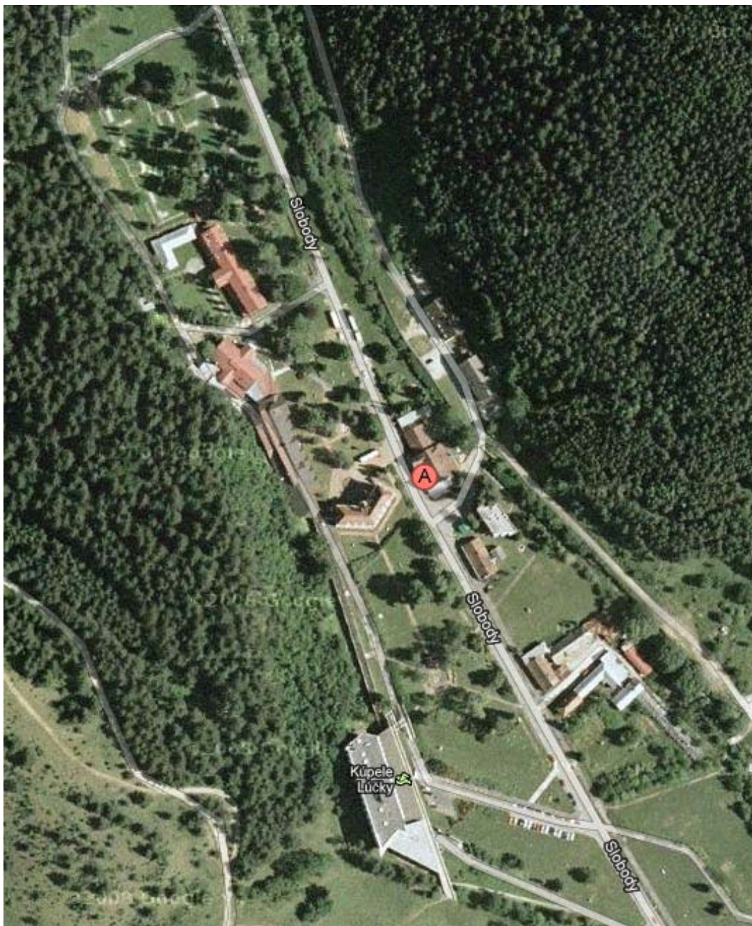
Privát Zuzana, Lúčky, Slobody 148